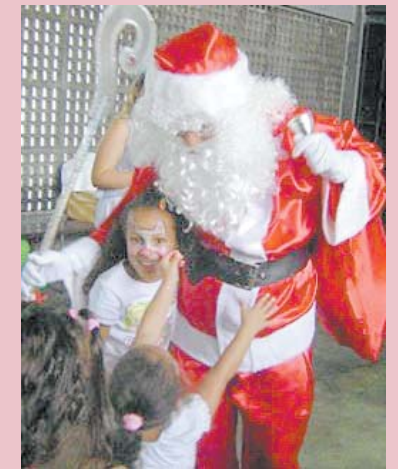
O Papai Noel é a alegria da garotada

As crianças do orfanato Lar Batista da Criança vão ganhar uma festa de Natal, no dia 9 de dezembro. O evento, que é uma iniciativa da SEITON Cursos, é uma festa com direito a presentes, ceia, brincadeiras e muita diversão, além - é claro - de Papai Noel. Este não será o primeiro ano que a SEITON organiza um Natal para crianças, a novidade é que será em um orfanato.